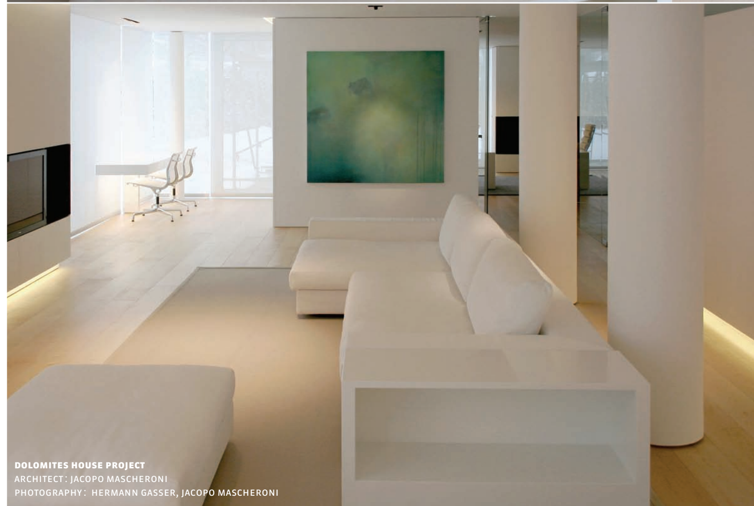
DOLOMITES HOUSE PROJECT ARCHITECT: JACOPO MASCHERONI

“My definition of luxury is being able to choose.”