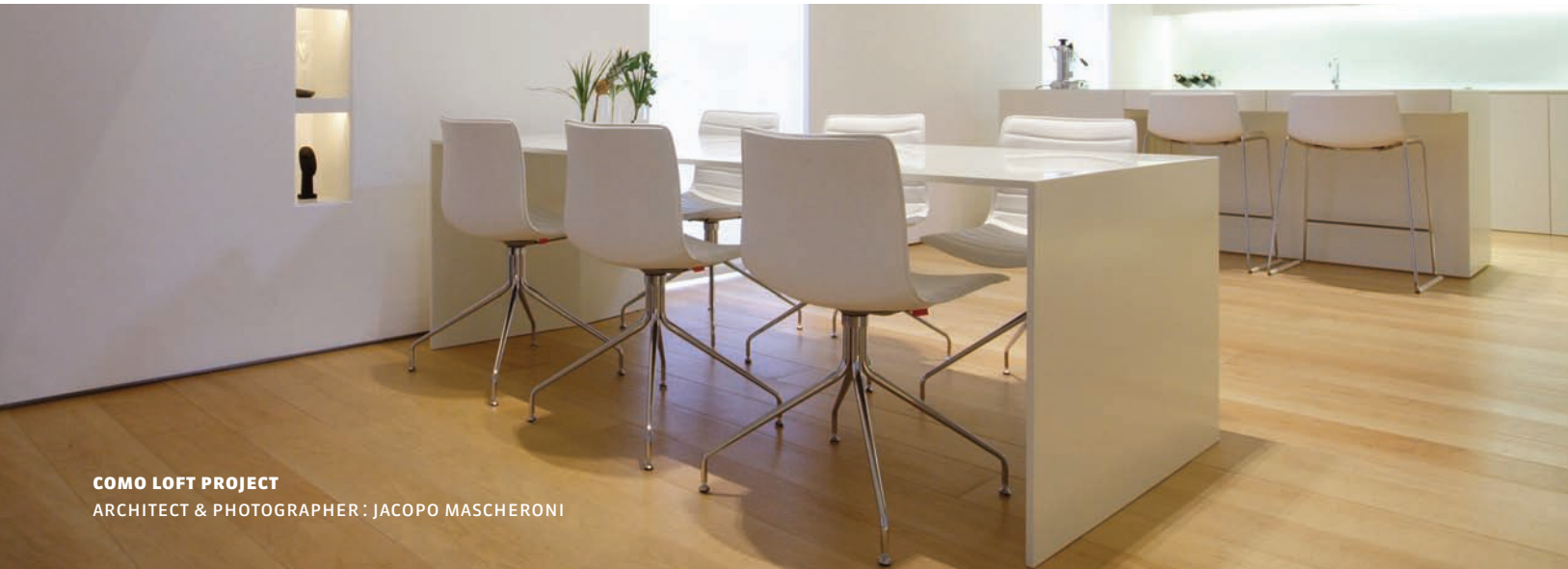
COMO LOFT PROJECT ARCHITECT & PHOTOGRAPHER : JACOPO MASCHERONI

QUAND ON PENSE MAISONS DE MONTAGNE, ON PENSE À DES BOISERIES RICHES ET FONCÉES. L'AIRE OUVERTE ET LE DESIGN MINIMALISTE TOUT EN BLANC DE LA MAISON DE CAMPO TURES DÉFIENT LA TRADITION. D'OÙ VOUS EST VENU CE DESIGN ?