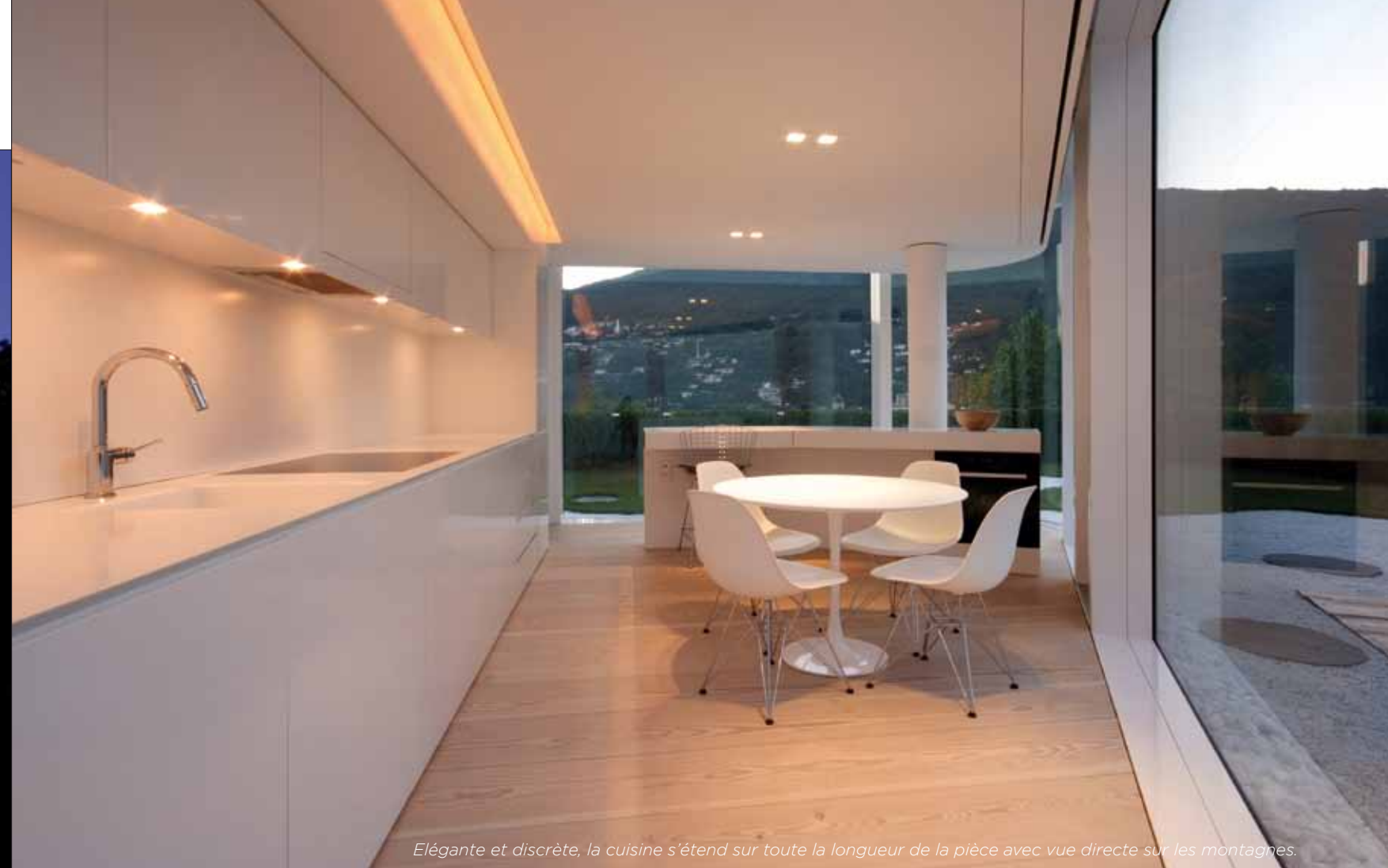
Elégante et discrète, la cuisine s'étend sur toute la longueur de la pièce avec vue directe sur les montagnes.