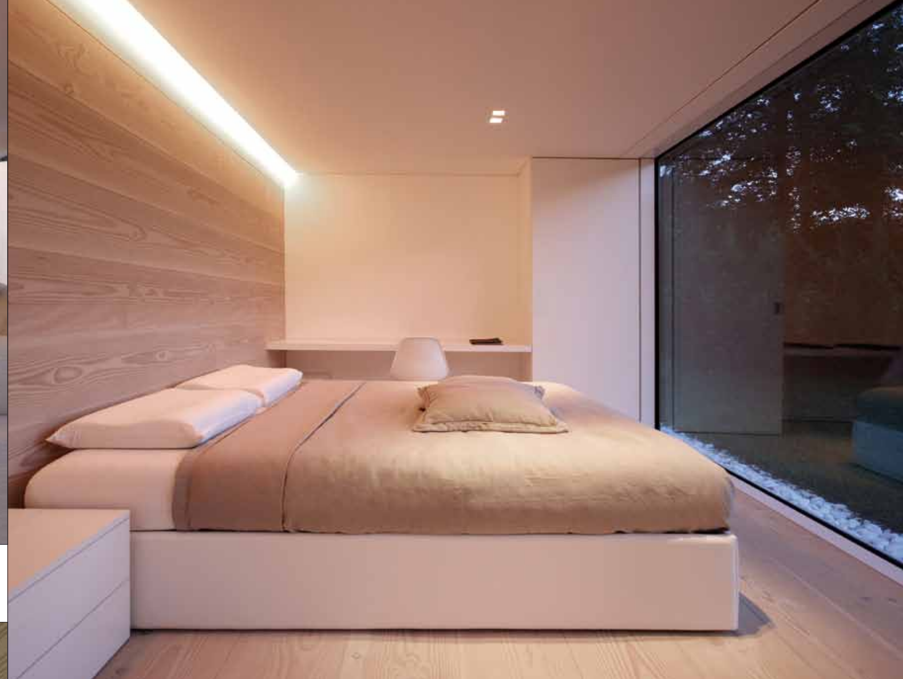
Les lignes simples de la chambre redonnent la part belle à ses fonctionnalités de base : la sérénité et le repos.

Elle lèche ainsi les angles et rafraîchit les espaces d'une clarté toute naturelle. Cuisine, sofas, lits et meuble de salle de bains furent dessinés spécialement pour la villa par JMA tandis que quelques pièces classiques de design, les Plastic Armchair et Sidechairs de Charles et Ray Eames (Vitra), la table Tulipe d'Eero Saarinen (Knoll), finissent le tableau en toute beauté.