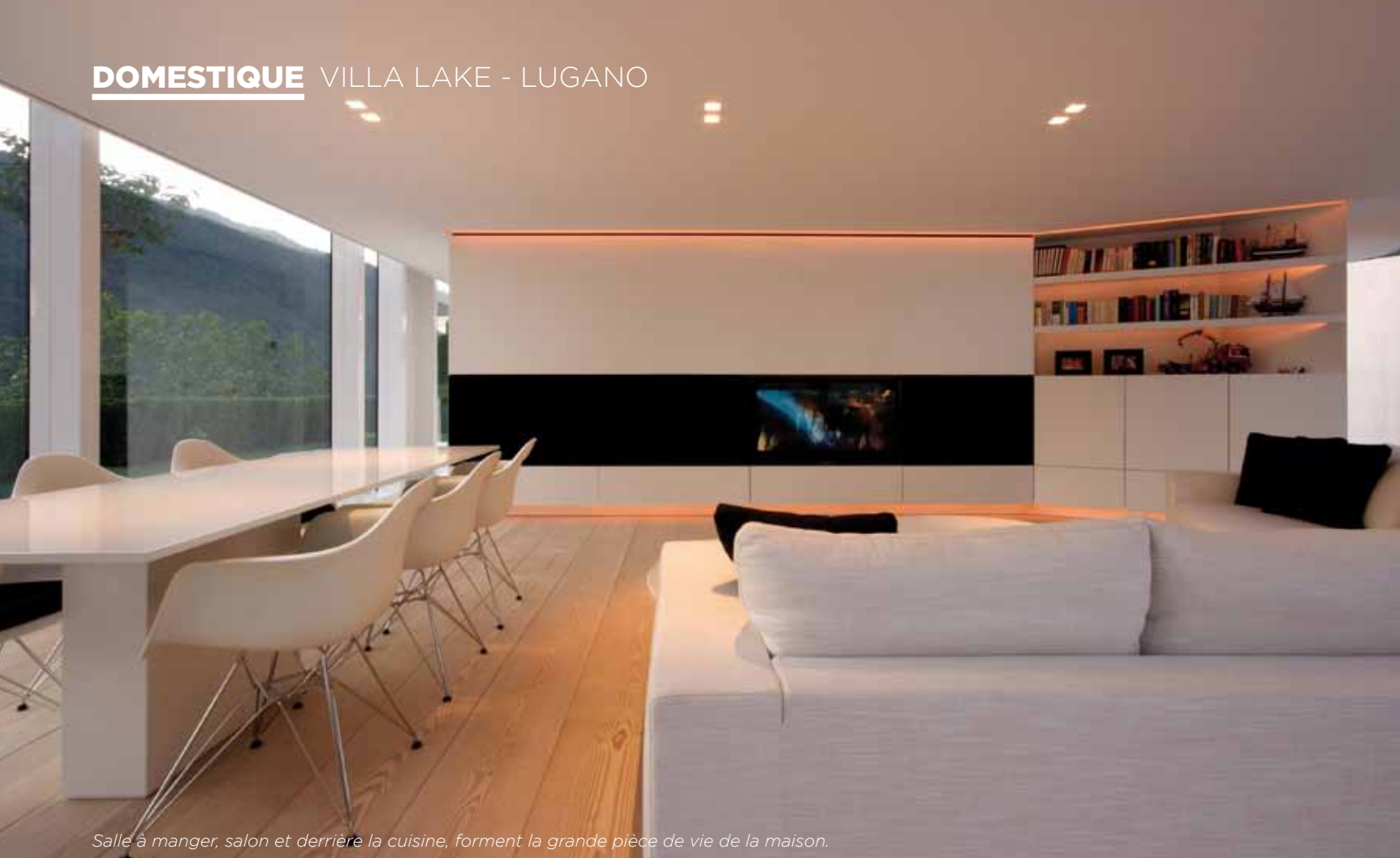
Salle à manger, salon et derrière la cuisine, forment la grande pièce de vie de la maison.