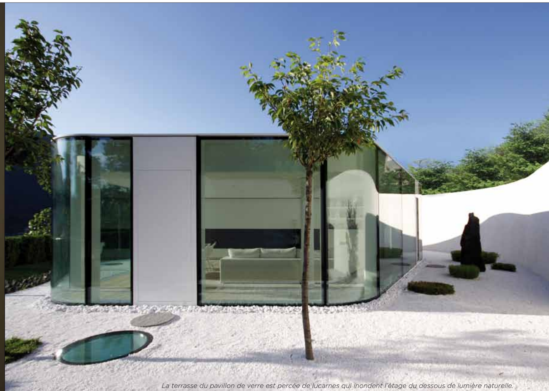
La terrasse du pavillon de verre est percée de lucarnes qui inondent l'étage du dessous de lumière naturelle.

Au départ, c'est une destination. Celle de la province de Varèse au nord de la plaine du Pô. Un endroit préservé où les familles très aisées du monde entier adorent venir se reposer. Le calme suisse dans toute sa splendeur, grandeur nature... et quelle nature ! Sept lacs, des montagnes et une vue - des vues ! - à perdre haleine. Pour Jacopo Mascheroni, ce bel espace ne peut que satisfaire son architecture qu'il aime soignée, élégante et confortable. Une jolie mise en bouche s'offre donc à lui.