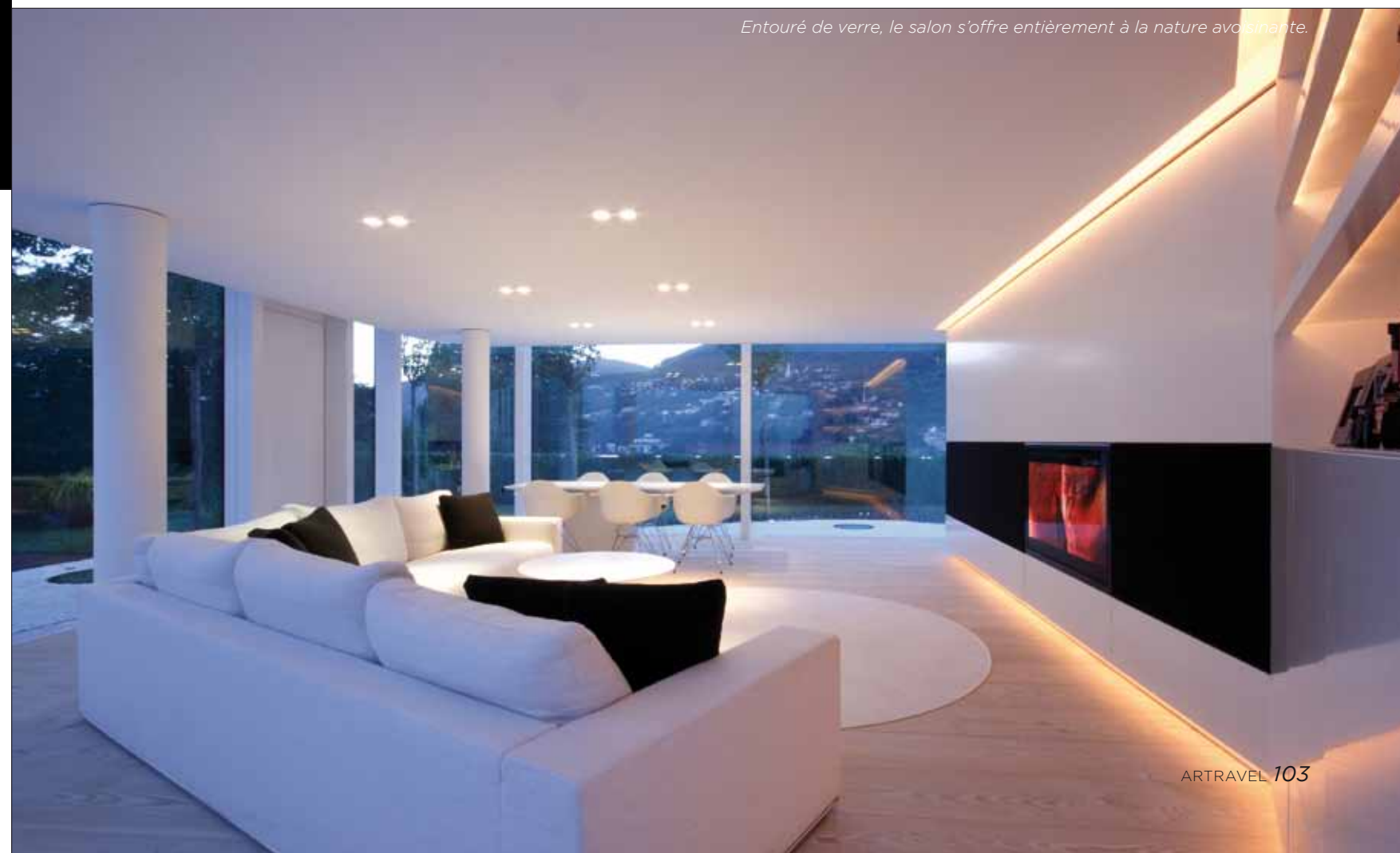
Entouré de verre, le salon s'offre entièrement à la nature avoisinante.

Un savoir-faire pragmatique auquel l'intérieur de la villa n'échappe pas. Une « fausse paroi » située au centre du Pavillon sert ainsi de hub intelligent, qui gère en un tour de main toutes les parties fonctionnelles de la maison, de la cuisine en passant par la cage d'escalier mais aussi tous les systèmes technologiques et audio-vidéo de la villa faisant ainsi de l'habitation un cocon vert qui ne s'épargne pas les joies de la modernité !