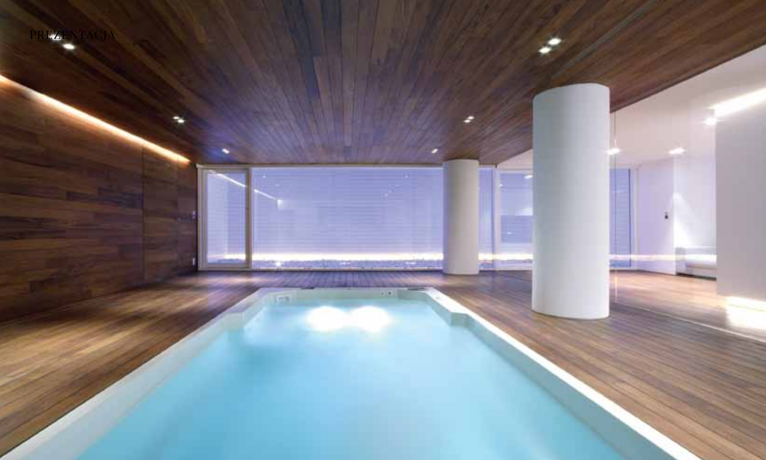
▲ Strefa wypoczynku to przede wszystkim duży basen (6 x 2,5 m), wyposażony w funkcję hydromasażu.