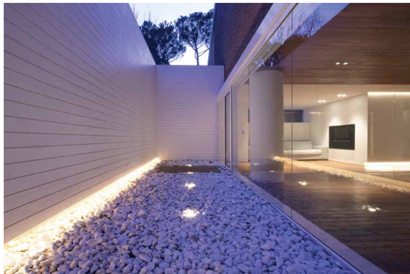
Integralnym elementem strefy wypoczynku jest oryginalne patio, nawiązujące stylem do minimalistycznych, japońskich ogrodów. ▼