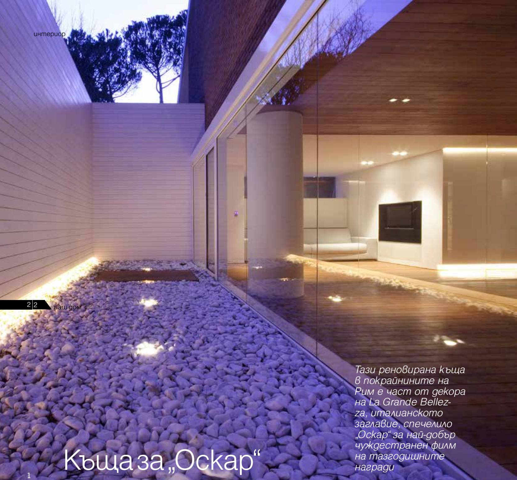
2 | 2 наш дом